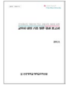
〈교육과정 기초 설문 결과 보고서〉

대학교육혁신원에서 단과대학 및 학부(과)별로 인재상 배양에 필요한 전공 역량을 조사하기 위하여 교수자 대상 기초 설문을 실시하였다. 2015년 8월 18일부터 8월 19일까지 전체교수워크숍 기간 동안 사전 제작한 설문지를 배포한 후 174명의 설문지를 회수하였으며 그 중 173명의 응답자를 분석하였다. 분석 방법은 AHP, 기술통계, IPA, 내용분석을 적용하였다. 단과대학 및 학부(과)별 제공된 분석 결과 자료는 다음과 같다.