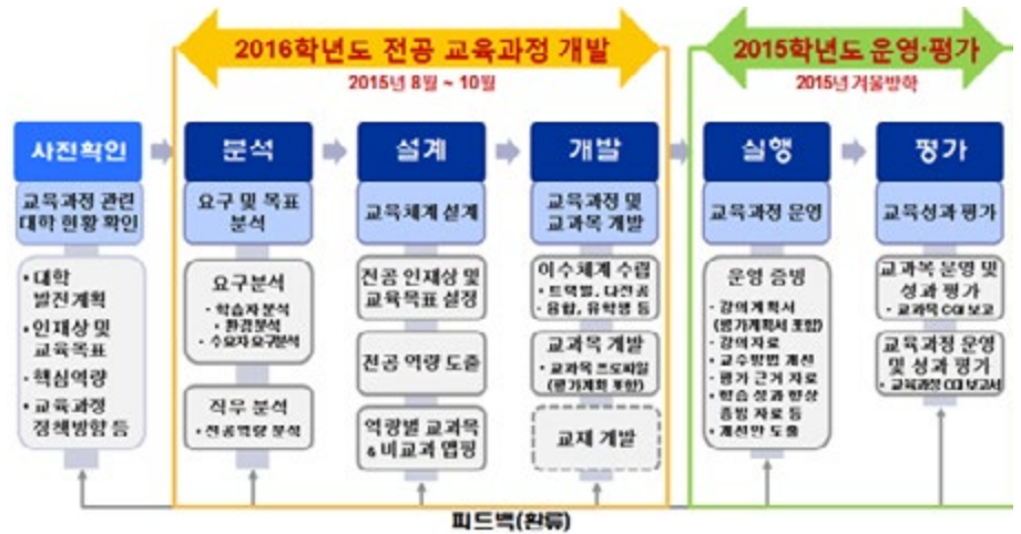
〈전공 교육과정 개편 및 실적화 범위〉

2015학년도 교육과정 개선은 아래와 같이 크게 두 가지 목적이 설정되었다. 첫째, 2016학년도 역량기반 전공 교육과정 운영을 위한 사전 개편 작업 진행이며, 둘째, (2014학년도에 진행된 핵심역량기반 교육과정 개편 체제에 의거) 2015학년도 전공 교육과정 운영에 대한 평가 및 개선환류 실적화이다. 여기에서는 첫 번째 목표 관련 추진 결과를 제시하고자 한다.